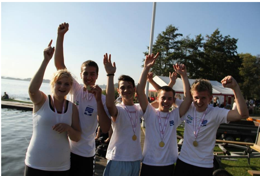
Sådan! Odder Roklubs stolte og glade vindere af juniorernes inrigger løb ved DM på Brabrand Sø.

Udover roning på vandet kan Odder også fremvise 35.000 kilometer roet i ergometrene i løbet af sommeren, så det er en enestående aktivitet, der præger den østjyske klub. Per Amby har som sædvanligt sendt gode billeder og en flot rapport til Motionsturneringen.