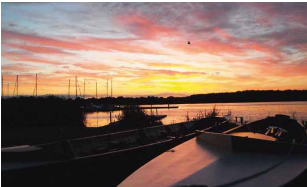
Præstø Fjord.

er der ikke uventet særlige forhold og spørgsmål, som det er vigtigt, at vi forholder os til, såfremt strukturen ændres, således at vi ikke taber noget i processen. Bestyrelsen har meget fokus på dette.