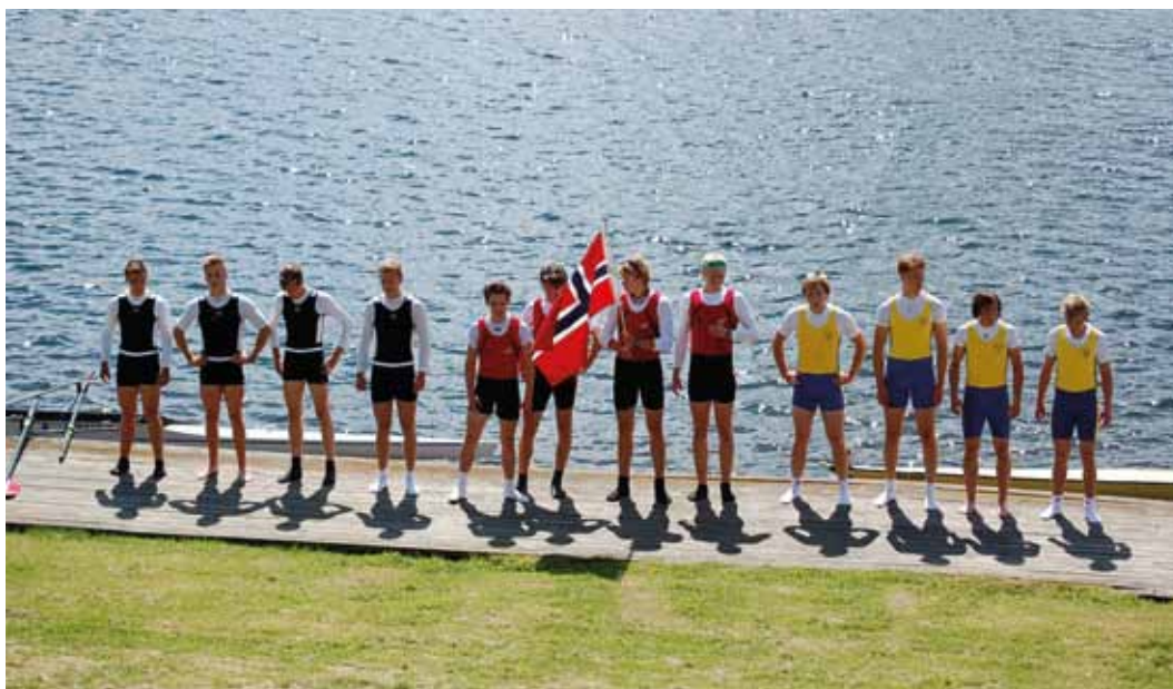
Nordisk Mesterskab i Finland.

Generelt har klubberne været positive overfor processen og tankerne omkring netværk. Samtidig